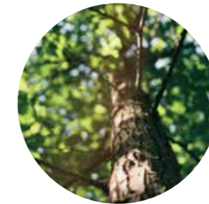
2000 से भी ज़्यादा वृक्षों का रोपण