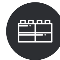
Kid's Gaming Zone