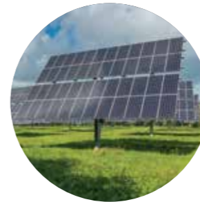
सौर ऊर्जा से चलने वाला सिस्टम