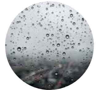
वर्षा जल संचयन के लिए प्रतिबद्ध