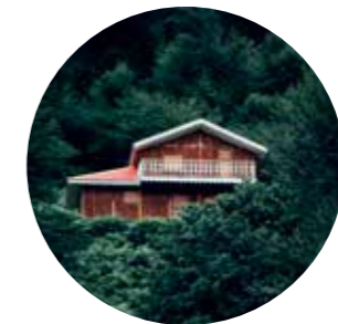
खुली जगह और निर्मित जगह के बीच में 80:20 का अनुपात